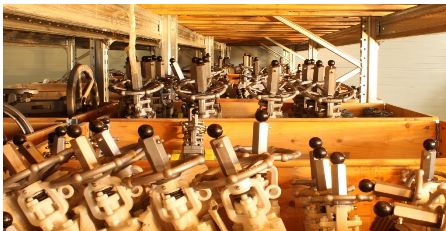
Flow Control Norway har en stor spennvidde av ventiler på sitt lager.